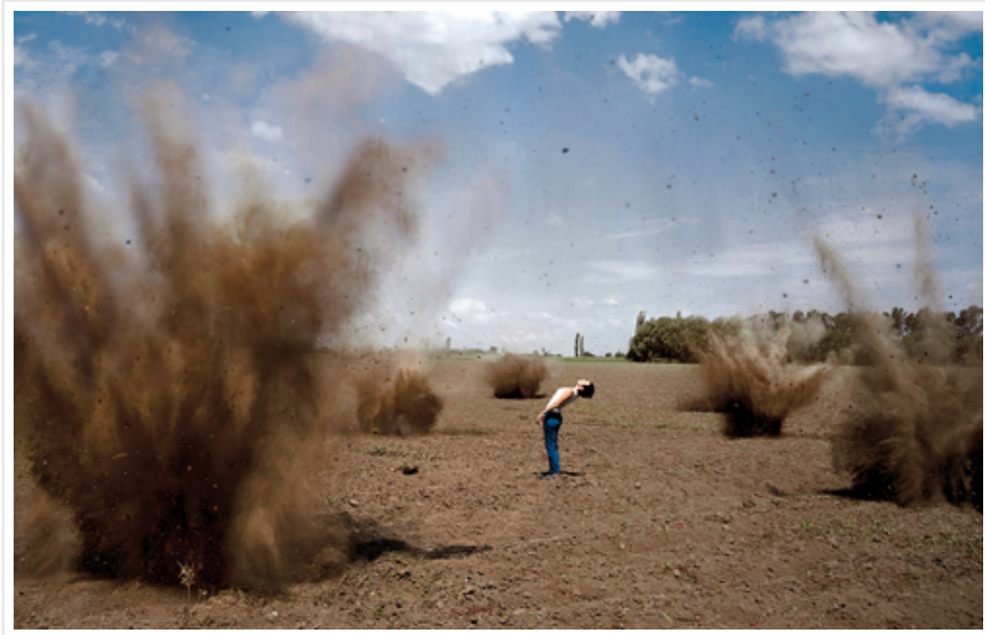
“El secreto tenía que develarse”, fotografía directa, 180x127 cm, 2011.

“Crímenes banales” es y ha sido un proyecto fundamental tanto en lo personal como en mi carrera. Ha sido valorado y reconocido a nivel nacional e internacional y me ha dado en este sentido muchísimo más de lo que esperaba, como formar parte de la Colección de la Tate Modern Gallerie, por ejemplo. En lo personal, el abordaje y la realización ha sido un proceso muy intenso y doloroso. Recuerdo que cuando ingresé a la sala J del Centro Cultural Recoleta me recorrió un frío filoso y me dije: ¿esto es mío?